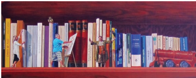
Murale Cœur, culture et pédagogie, M.U.R.I.R.S., Sherbrooke