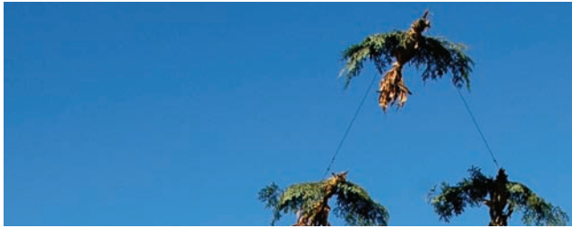
Outardes, Équipe du Pavillon de la pomme, Mont-Saint-Hilaire