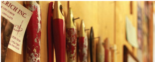
Laboratoire artistique de développement local, un élu-un artiste, Tracadie-Sheila

14 Engagement 14. Agir en collaboration avec tous les acteurs du milieu pour protéger et mettre en valeur le paysage, le patrimoine bâti, le patrimoine immatériel, les archives et les autres témoins de l'histoire locale