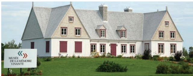
Musée de la mémoire vivante, Saint-Jean-Port-Joli

12 Engagement 12. Valoriser la langue française comme vecteur d'identité culturelle au Québec, en Acadie et ailleurs dans la francophonie canadienne