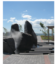
Ville de Sept-Îles