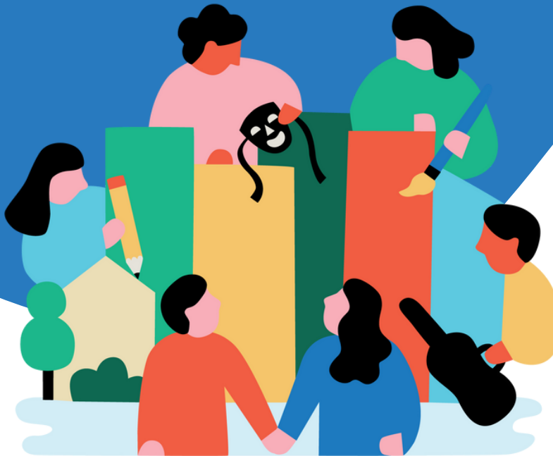
Illustration : Myriam Van Neste